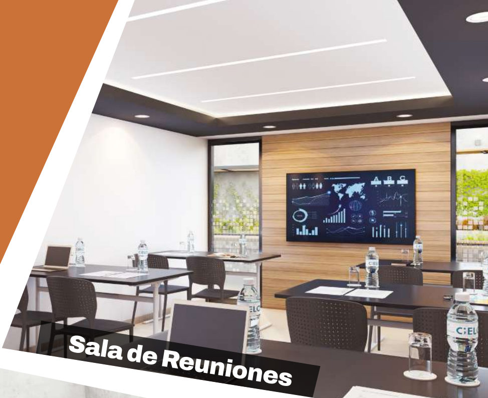
Sala de Reuniones