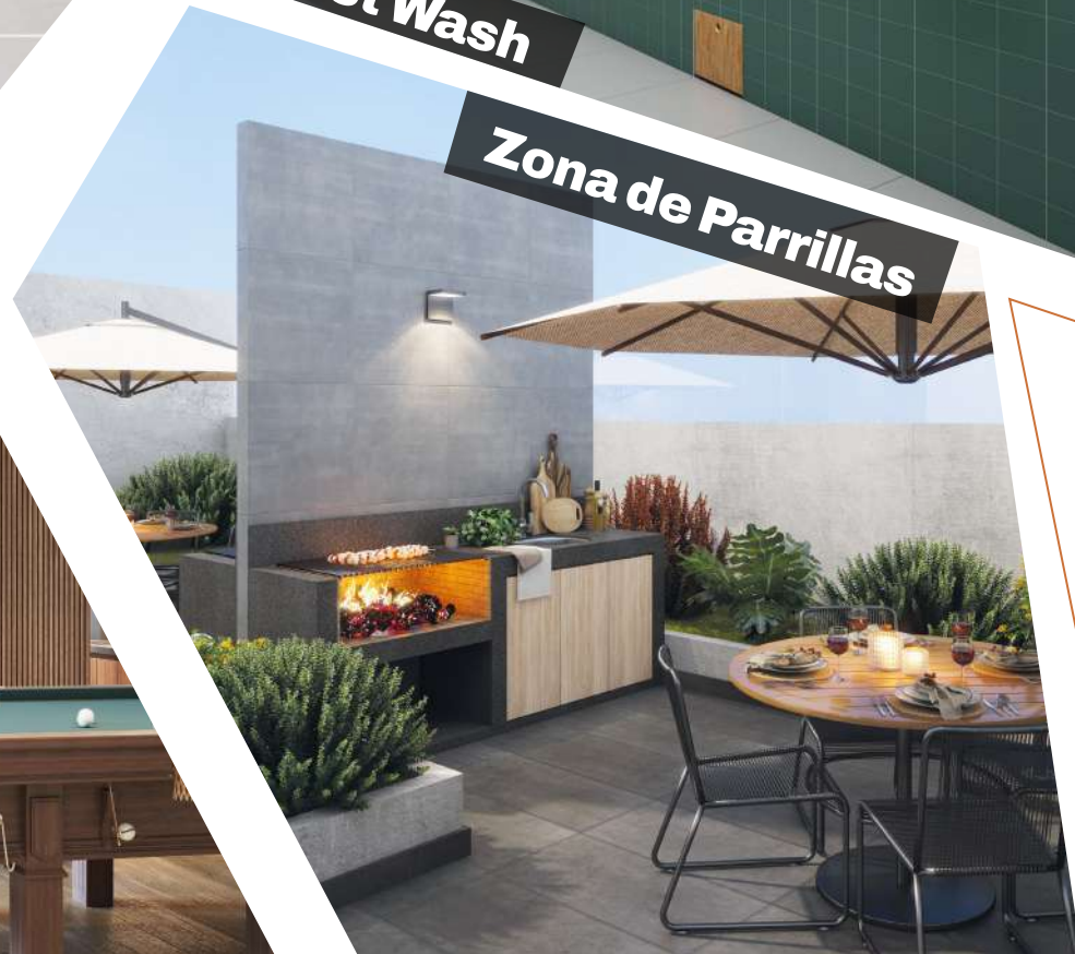
Zona de Parrillas