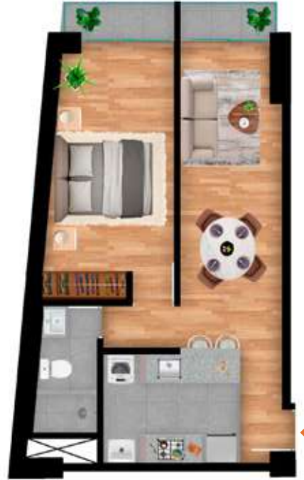
207 al 3007