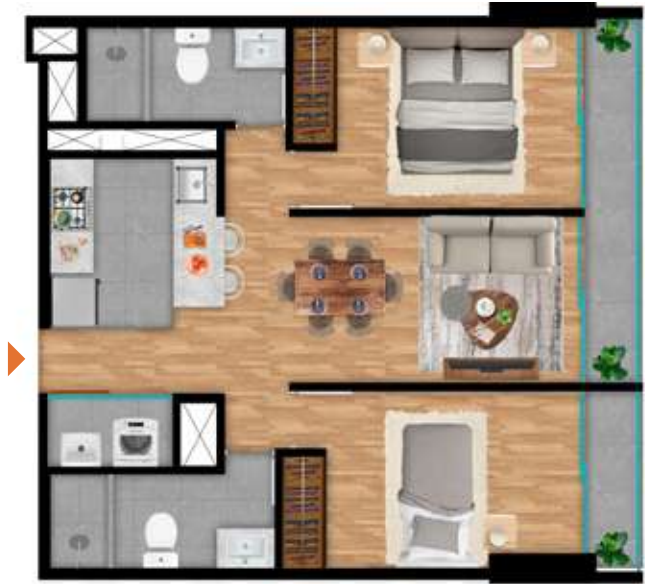
206 al 3006