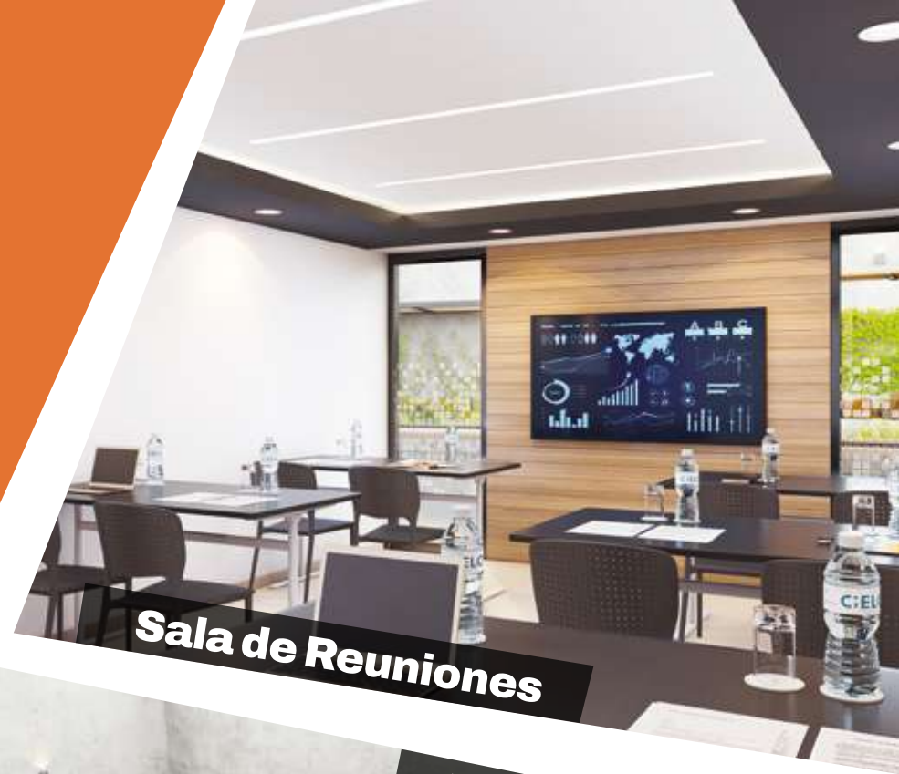
Sala de Reuniones