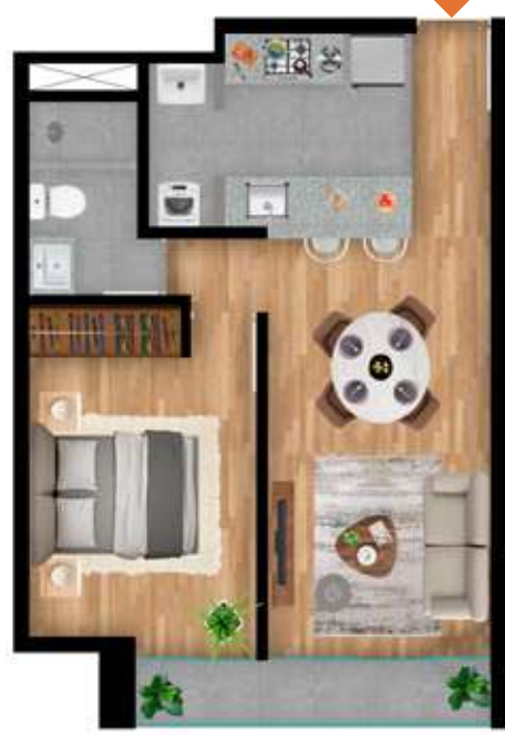
205 al 3005