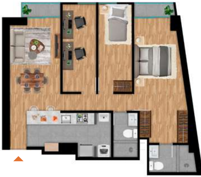
204 al 3004