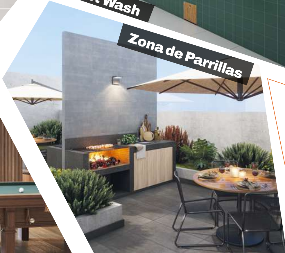
Zona de Parrillas