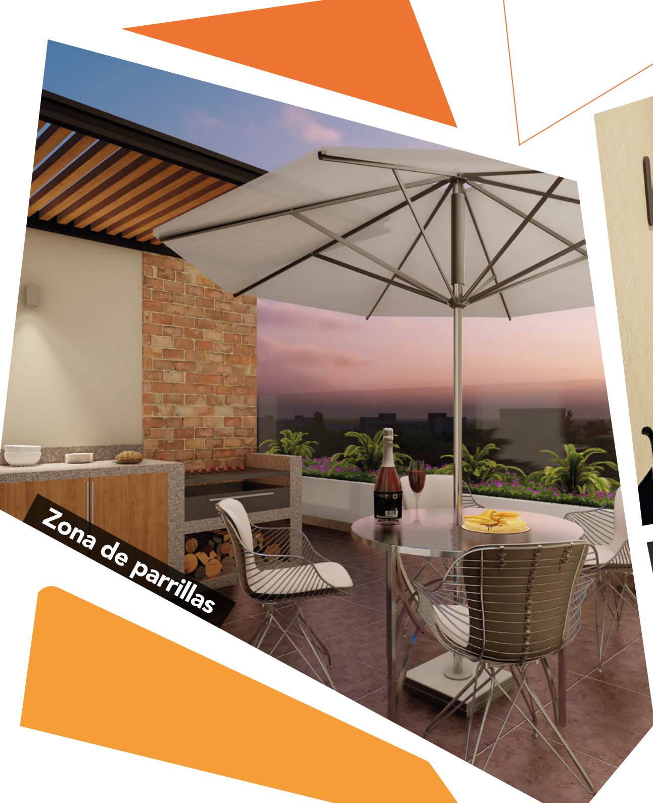
Zona de parrillas